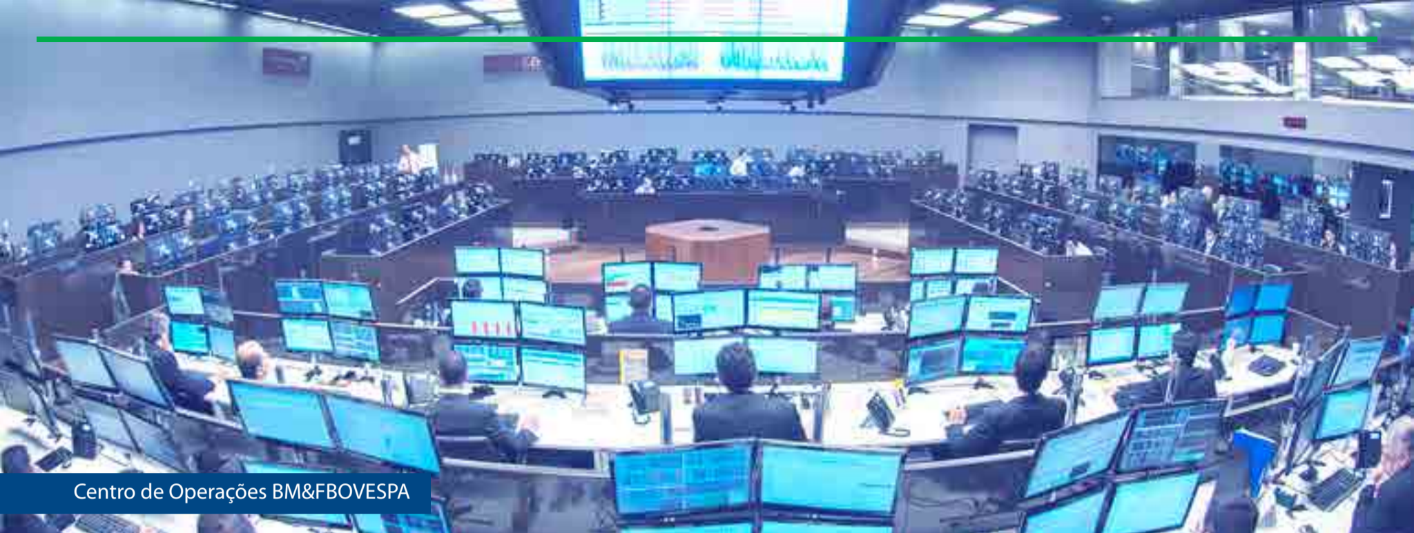
Centro de Operações BM&FBOVESPA

Administradores, funcionários e estagiários da BM&FBOVESPA,